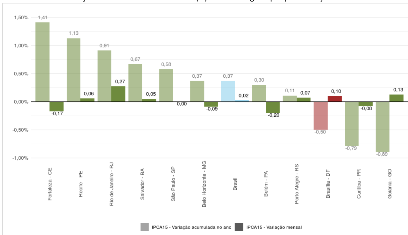
Gráfico 1: IPCA-15: Variação mensal e acumulada no ano (%) – Brasil e regiões pesquisadas – junho de 2020